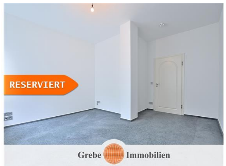
Kinderzimmer Bild 2