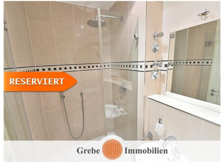
Bad mit Dusche