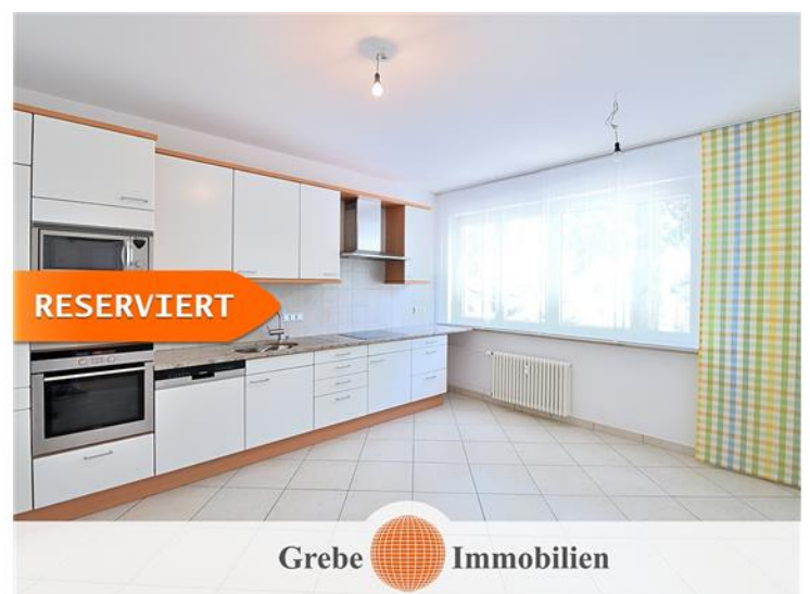
Küche mit neuer...