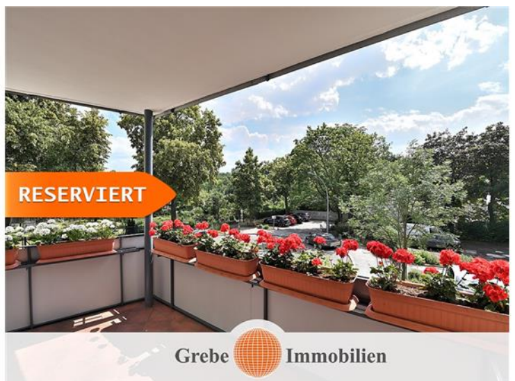
Immobilienmakler Berlin Wohnung kaufen