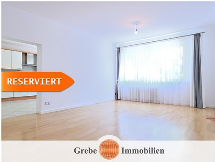
Wohnzimmer Bild 2