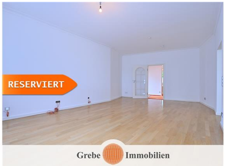
Wohnzimmer Bild 5