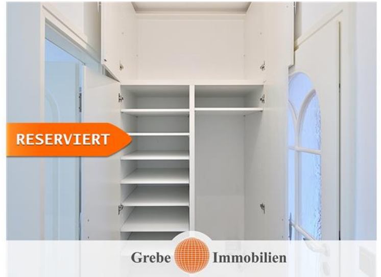
1 von 2 Schränken