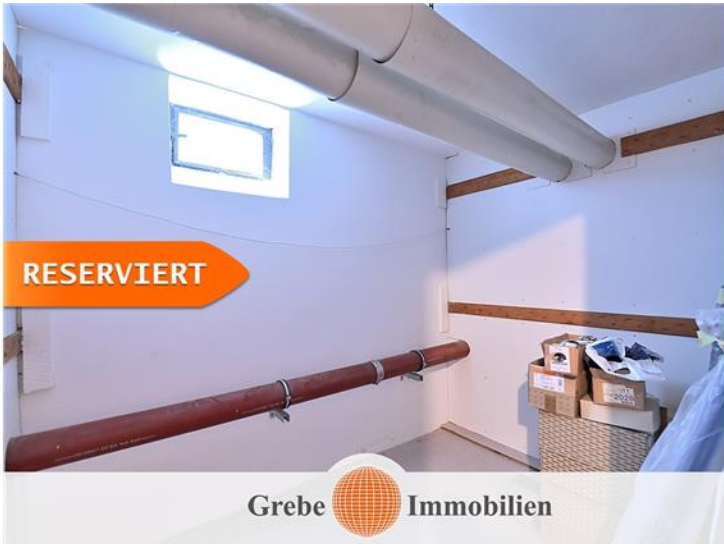
Keller 1 von 2