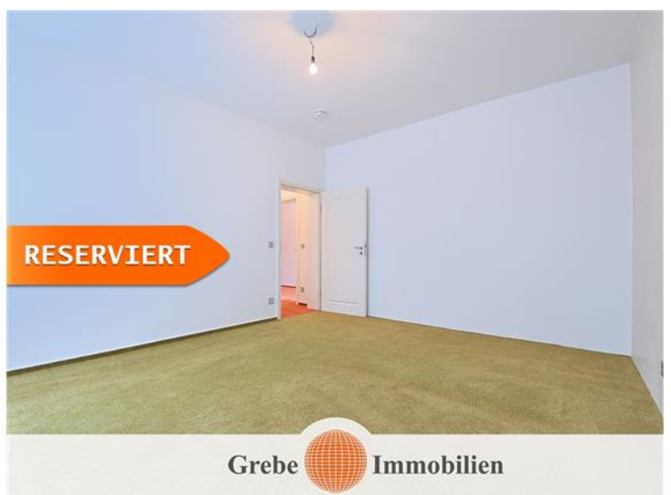
Elternschlafzimmer Bild 2