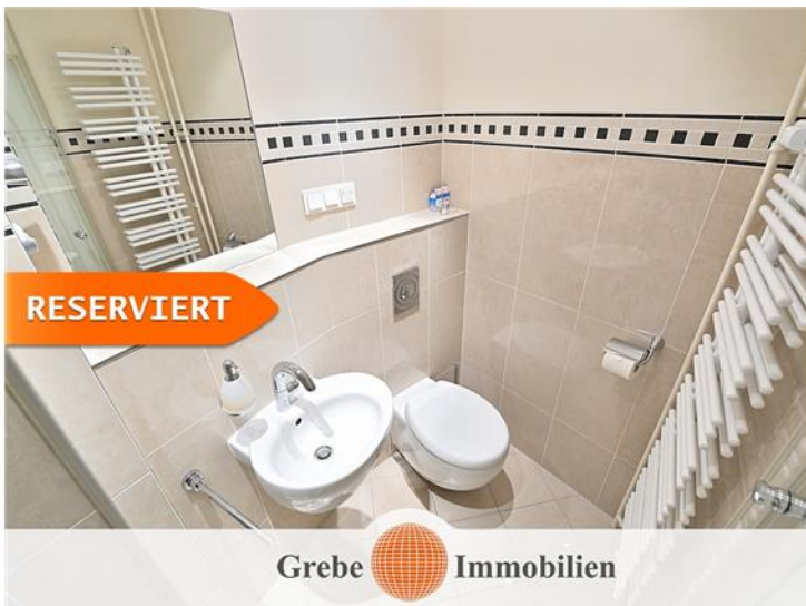
Gäste WC Mit Handtuchheizung