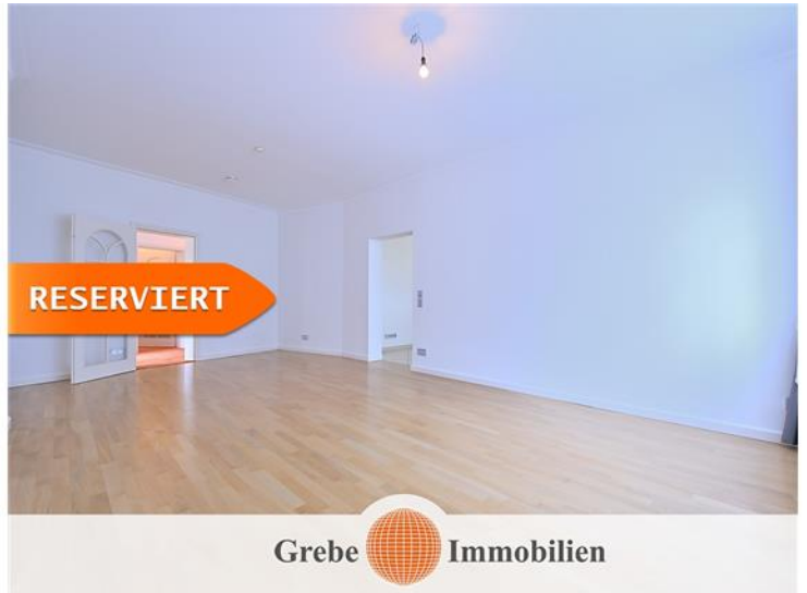
Wohnzimmer Bild 3