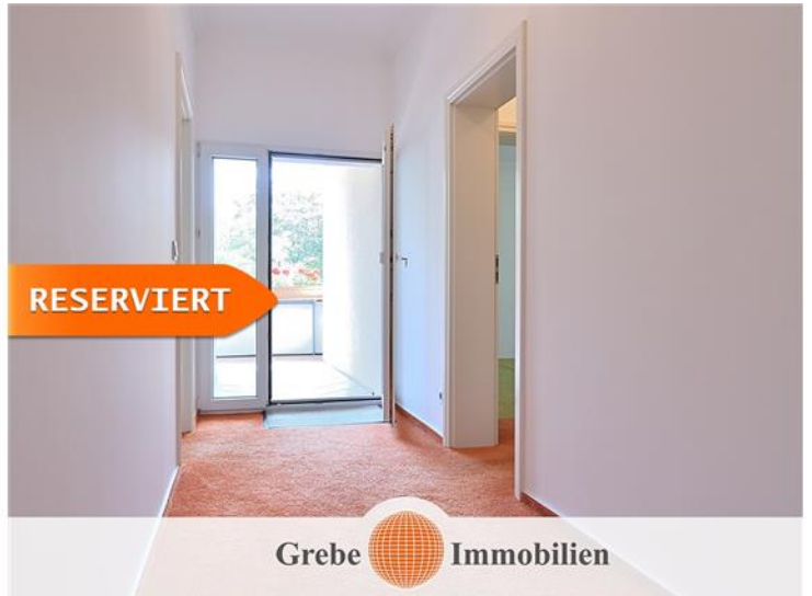
Balkon am Flurende