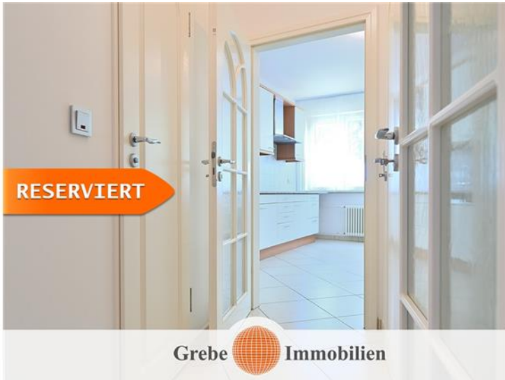
Zur Küche & Gäste Bad