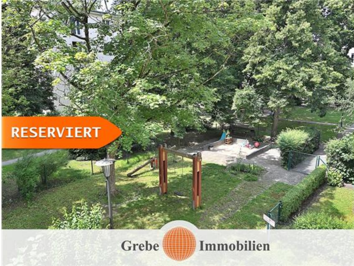
Ausblick zur Gartenseite