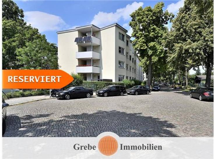
Sackgasse = Ruhige Lage