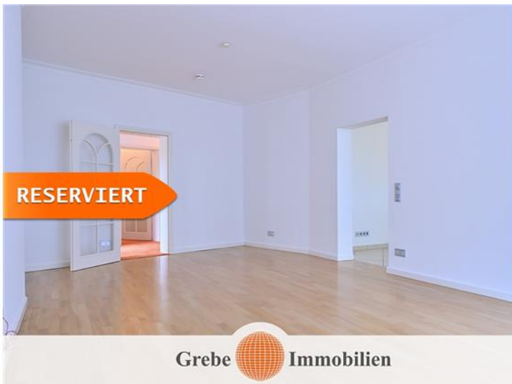
Wohnzimmer Bild 4