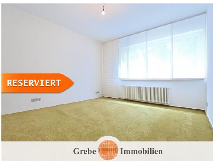
Elternschlafzimmer mit Fensterfront